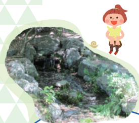
ししく 獅子吼 Shishiku "Lion's Roar Cascade"