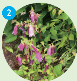
2 ホタルブクロ Spotted bellflower 6月