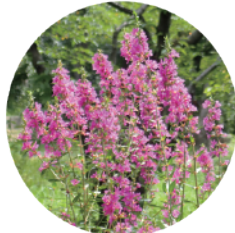
ミソハギ Purple loosestrife