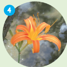
4 ノカンゾウ Orange daylily 7月~9月