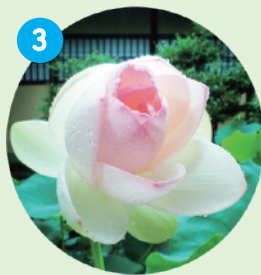
3 ハス Lotus 7月~8月