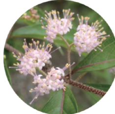
コムラサキ Purple beautyberry